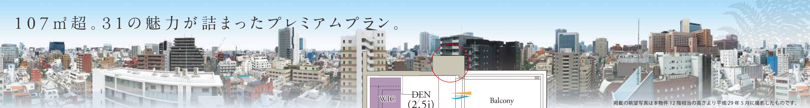
掲載の眺望写真は本物件 12階相当の高さより平成29年5月に撮影したものです。